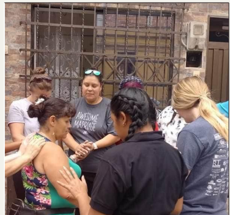
Ministración en la comunidad local

Más de 20.000 personas de la comunidad impactadas