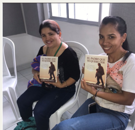
Escuela de padres