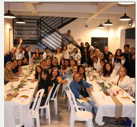
Cena con Jesús / clausura