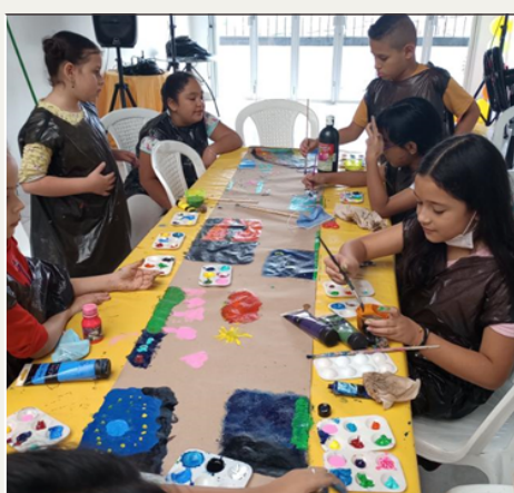
Clase de artes