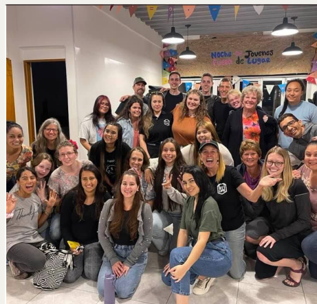
Intensivo de misiones