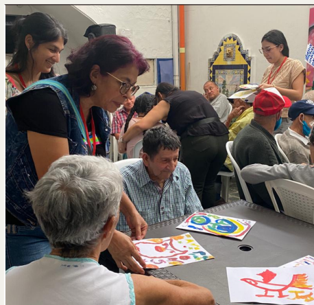
Visita Hogar VIVE