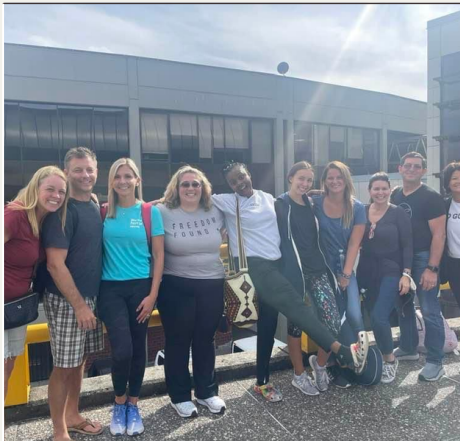
Equipo Grow Church