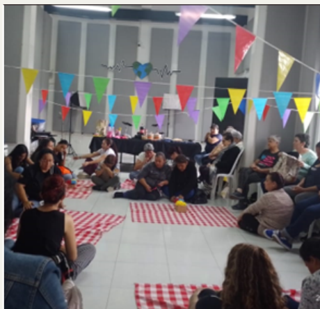
Celebración día del amor y la amistad