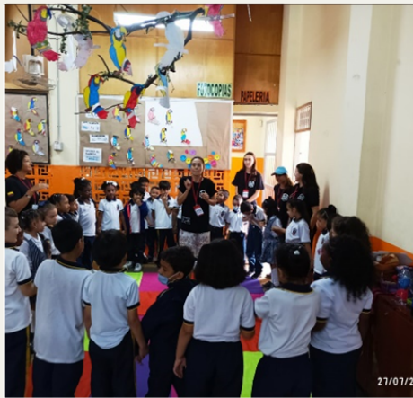
Jornada Liceo Javiera Londoño