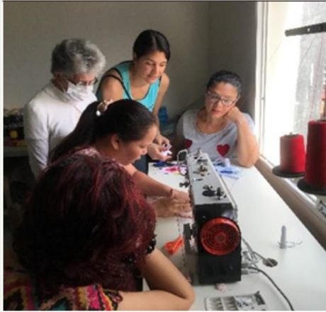
Sala de confección