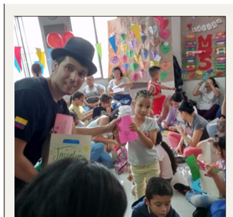
Celebración del amor y la amistad

El acto de clausura como evento de despedida del año y cierre de procesos, este año 2022 contó con la participación y vinculación de voluntarios de la Asociación Granos de Arena y del Fondo de empleados de Isagen, que donaron los regalos para los niños usuarios del proyecto CDH y se hicieron cargo de la recreación del evento con la participación de un mago-payaso animador. Durante esta jornada se les dio un recorrido a los visitantes y donantes asistentes por las instalaciones de la fundación y se les entregó un presente de agradecimiento por parte de la Fundación, por todo el apoyo recibido durante el año a los diferentes proyectos.