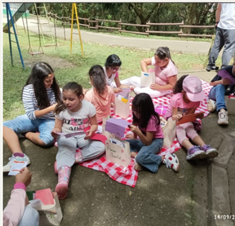
Salida parque la Asomadera